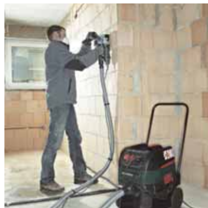
Bild 1 und 2: Beispiele für abgestimmte Systeme: Mauernutfräse und Winkeltrennschleifer mit Umbausatz für Mauernutfräse mit einem Entstauber der Staubklasse M