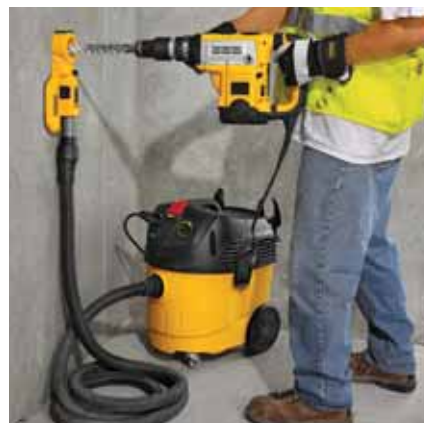
Bild 3 bis 6: Beispiele für abgestimmte Systeme: Kombihammer und Diamantbohrmaschine für das Dosensenken, Bohren und Stemmen mit zusätzlicher Erfassungseinrichtung und einem Entstauber der Staubklasse M