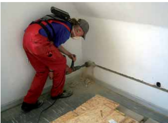
Dosensenken ohne Absaugung mit deutlich erkennbarer Staubentwicklung

Überschreitungen des allgemeinen Staubgrenzwertes können außerdem durch nachfolgende ungünstige Einflussfaktoren auftreten: